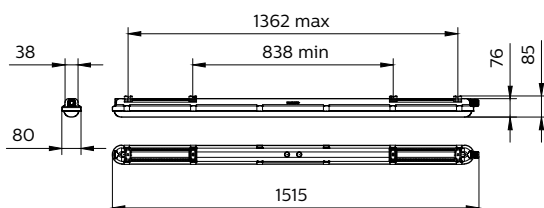
CoreLine Waterproof WT120C