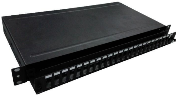
VAERK Fiber Optic Distribution Product---19 tommer 1U patchpanel