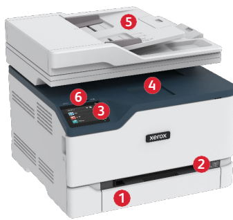
Xerox® C235 fargemultifunksjonskriver