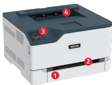
Xerox® C230 fargeskriver