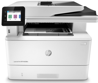
HP LaserJet Pro MFP M428fdn

Suksess i forretningslivet betyr å arbeide smartere. HP LaserJet Pro MFP M428 er utformet for å la deg fokusere tiden din der den er mest effektiv, slik at du kan la virksomheten vokse og beholde forspranget overfor konkurrentene.