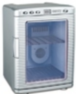
Mini-fridge CR 8062