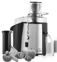
Juice extractor CR 110