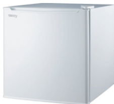
Aggregate refrigerator CR 8064