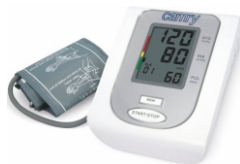
Arm blood pressure monitor CR 8409