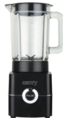
Blender CR 4050