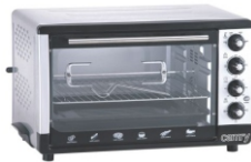
Electric oven CR 111