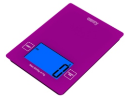
Electronic kitchen scale CR 3149