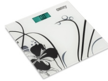
Electronical bathroom scale CR 8118