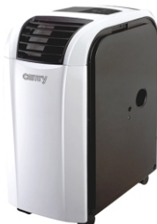
Air conditioner CR 7902