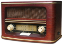
Retro radio CR 1103