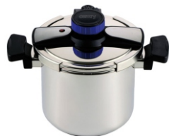
Pressure cooker CR 6726