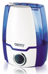
Air humidifier CR 7952