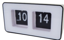
Auto-flip clock CR 1131