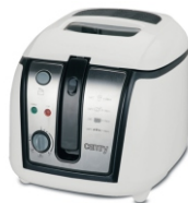
Deep fryer CR 4907