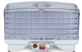
Food dryer CR 6653