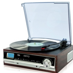
Turntable with radio CR 1113