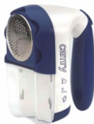
Lint remover CR 9606