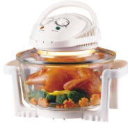
Halogen oven CR 6305