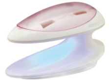
Manicure set CR 2151