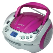
CD/MP3 player (boombox) CR 1123