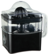
Citrus juicer CR 4001