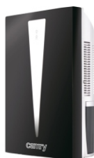
Air dehumidifier CR 7903