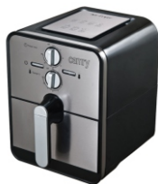
Air fryer CR 6306