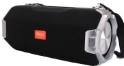
Bluetooth Speaker CR 1170