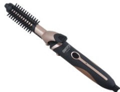
Hair styler set CR 2024