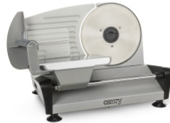
Food Slicer CR 4702