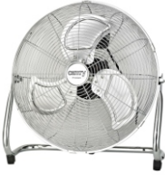
Velocity Fan CR 7306