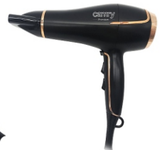
Hair Dryer CR 2255