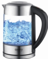
Kettle with temp. control CR 1289