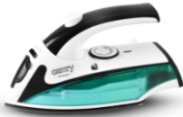
Travel Iron CR 5024