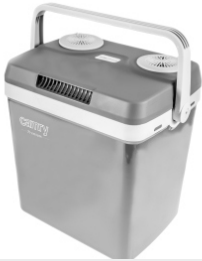
Portable Cooler CR 93