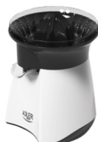
Citrus Juicer AD 4005