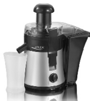
Juice Extractor AD 4106