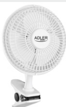
Desk fan 15 cm with clip AD 7317