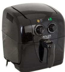
Air fryer AD 6307