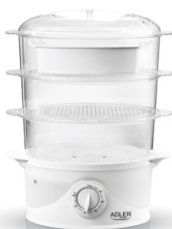
Steam cooker AD 633