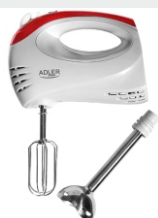
Mixer with blending shaft AD 4212