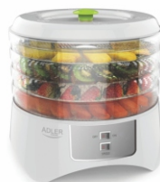
Food dryer AD 6654