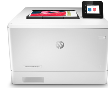
HP Color LaserJet Pro M454dw

Denne skriveren er ment kun å fungere med tonere som har en ny eller gjenbrukt HP-brikke, og den bruker dynamiske sikkerhetstiltak for å blokkere tonere som ikke bruker HP-brikker. Regelmessige fastvareoppdateringer opprettholder effektiviteten til disse tiltakene og blokkerer blekkpatroner som fungerte tidligere. En gjenbrukt HP-brikke muliggjør bruk av gjenbrukte, bearbejdede og etterfylte blekkpatroner. Mer informasjon på: http://www.hp.com/learn/ds