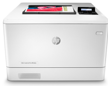
HP Color LaserJet Pro M454dn

Suksess i forretningslivet betyr å arbeide smartere. HP Color LaserJet Pro M454-skriveren er utformet for å la deg fokusere tiden din der den er mest effektiv, slik at du kan la virksomheten vokse og beholde forspranget overfor konkurrentene.